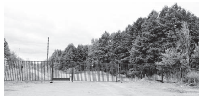
● Длина плотины Запасного пруда – порядка 4 км, но часть её огорожена. За воротами начинается заводская территория