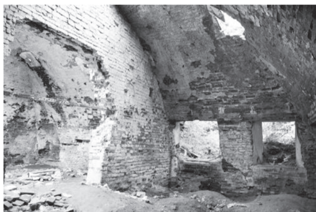
● О давности постройки говорит специфика кладки: именно так строили при Баташевых