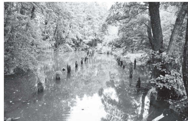
● На случай большого паводка были предусмотрены вешняки

На заводских плотинах был рабочий прорез, через который вода текла на водяное колесо. На случай большого паводка делались вешняки, предназначавшиеся для сброса вешних вод.