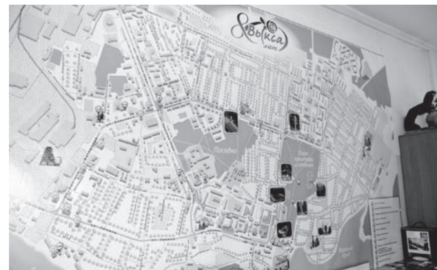
● В информационно-туристическом центре разработано четыре маршрута по Выксе

Сколько всего интересного о Выксе мы не смогли уместить на этих страницах! А сколько того, что лучше посмотреть воочию! В Выксунском информационно-туристическом центре (ИТЦ) разработано четыре экскурсионных программы по городу: две в виде квеста и две обзорные – по Выксе и парку. Этими маршрутами за прошедшие месяцы уже прошли порядка 400 человек. Хотите присоединиться? Запишите телефон ИТЦ: 8-951-902-67-52.