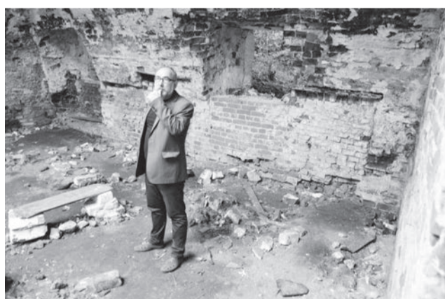
● С каждым годом строение всё больше и больше разрушается

– На ул. Шлаковой когда-то проходила узкоколейная железная дорога, связывающая Верхний и Нижний заводы, а ещё раньше здесь располагался Средний пруд. Если двигаться по ней, то мы попадаем в тот район Верхнего завода, где располагались мастерские. Это здание (см. фото), по неподтверждённым данным, либо мастерская, либо кузня, но то, что это бывшее производственное помещение – точно. Ещё недавно здесь имелись чугунные элементы. Сейчас их нет, здание всё больше разрушается, два года назад такого провала в своде не было. О древности постройки можно судить по специфике кладки: именно так строили цеха при Баташевых.