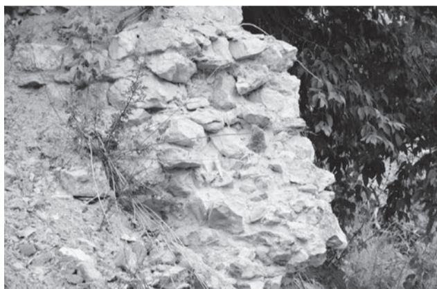
● Для её возведения использовался белый камень, который, скорее всего, привозили с касимовских каменоломен