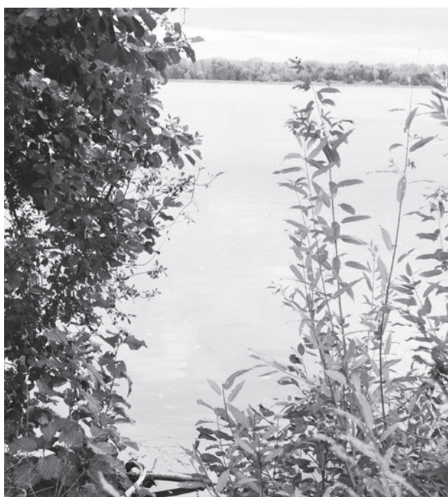
● Запасный пруд – самый большой в Выксе

– Мы выезжаем на плотину Запасного пруда, справа осталась старая узкоколейка. Длина плотины сейчас около 4 км, а при Баташевых, если верить карте XIX века, она практически доходила до Верхнего пруда. Запасный – самый большой из выксунских прудов. Размер зеркала в зависимости от уровня воды – порядка 6,45 км². Пруд настолько велик, что здесь постоянно дует ветер. Это идеальное место для занятий парусным спортом. Пляж Запасного когда-то был одним из самых любимых у выксунцев, именно на этот беленький песочек ездили на велосипедах, мотоциклах, ходили пешком, пока плотину не перекрыли (сейчас нужно ехать через Борковку).