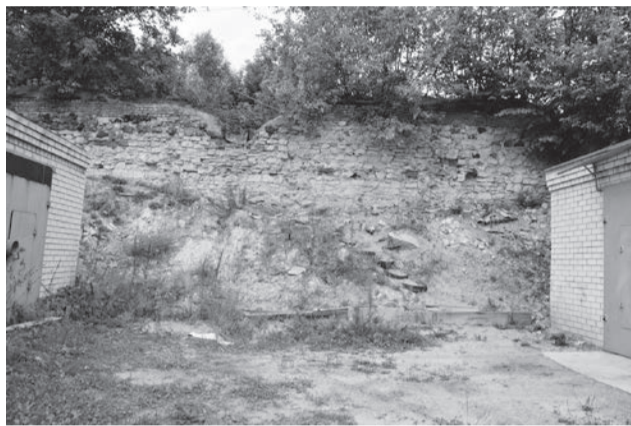
● В районе гаражей на ул. Шлаковой есть стена, которая, возможно, была частью набережной Среднего пруда