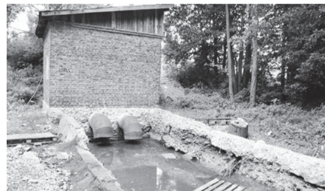
● Вешняки: современный вид

Сколько всего интересного о Выксе мы не смогли уместить на этих страницах! А сколько того, что лучше посмотреть воочию! В Выксунском информационно-туристическом центре (ИТЦ) разработано четыре экскурсионных программы по городу: две в виде квеста и две обзорные – по Выксе и парку. Этими маршрутами за прошедшие месяцы уже прошли порядка 400 человек. Хотите присоединиться? Запишите телефон ИТЦ: 8-951-902-67-52.