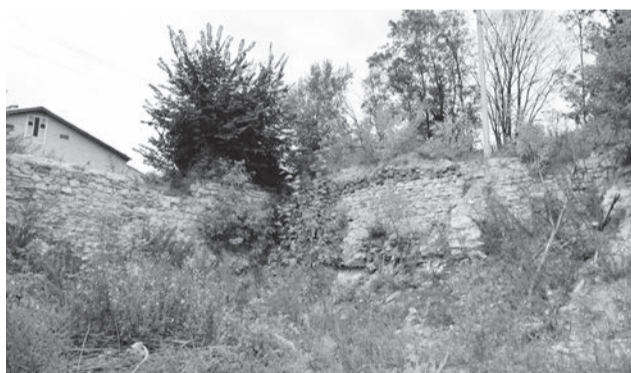
● Если у вас есть какие-то данные по поводу того, для чего предназначалась стена, свяжитесь с Выксунским ИТЦ